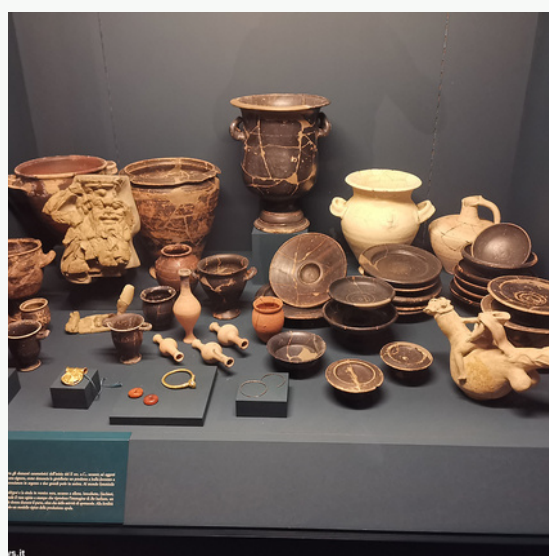
Museo Archeologico nazionale di Adria