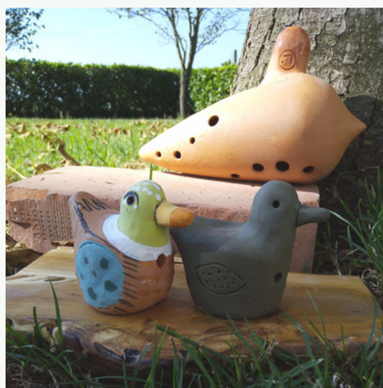
Museo dell'Ocarina, di Grillara