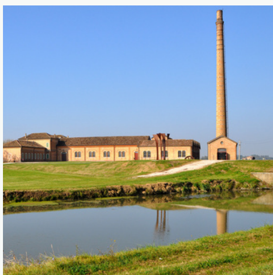
Museo regionale della Bonifica di Ca' Vendramin

Rosolina Mare Club si impegna a continuare a promuovere e incentivare la fruizione della cultura locale ampliando le informazioni ai nostri ospiti attraverso i nostri canali di comunicazione digitale e offline.